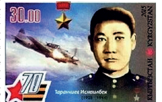
(Сүрөттө: Улуу Жеңиштин 70 жылдыгына карата Кыргызстандан ушундай почталык марка чыгарылган).