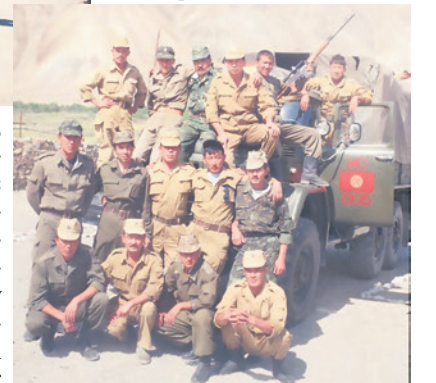
Сүрөттөрдө: тажик-аф-аткарганына токтолуп, канчалык коомдук бирикменин аткарган жана алдыдагы иш-чаралары айтылды.

Бакытка берилип, ал өзүнүн баяндамасында кыргыз армиясынын жоокерлеринин тажик-ооган чек арасындагы кооптуу кырдаалда, табияты катаал шартта өз милдеттерин так жана жоопкерчиликтуу аткарганына токтолуп, канчалык коомдук бирикменин аткарган жана алдыдагы иш-чаралары айтылды.